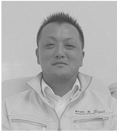
廃棄物管理士の資格をもつ中西社長