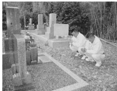
作業前後は必ず心を込めて合掌する(会社案内より)

「繁忙期に外注に頼んだところ、タバコを吸いながらお墓を掃除していたようで、お客様か